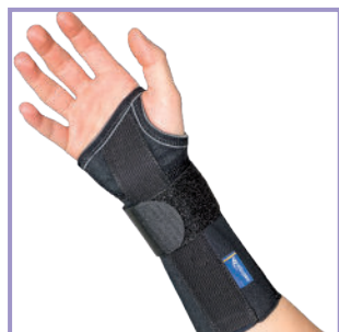
Origo Long Black – Art. 2261