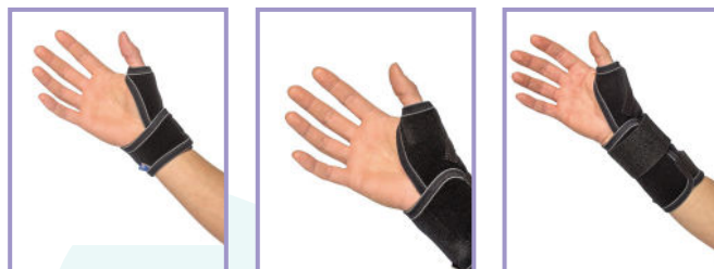
NRX® Thumb brace Short/Mid/Long – Art. 2350/2351/2352