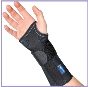
Origo Long Black – Art. 2261