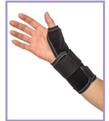
NRX® Thumb brace Short/Mid/Long – Art. 2350/2351/2352